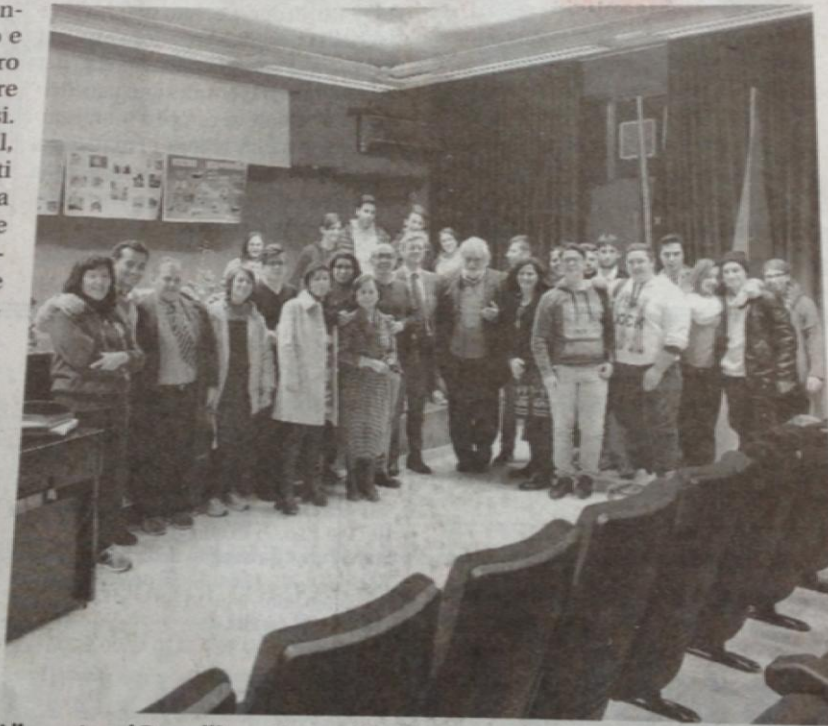
L'incontro al Borsellino coi consoli siciliani di Portogallo e Turchia