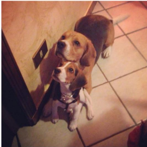
by Giuseppe Tutone