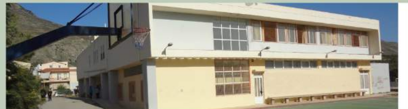
Geniko Lykeio Kroysona, Grecia