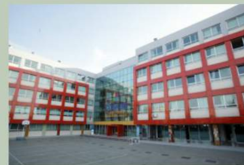
Istanbul Coskun ortaokulu, Turchia