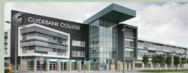
Clydebank College, Gran Bretagna