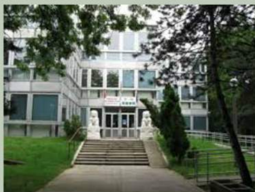
Sipkay Bana Kereskredelmi, Ungheria