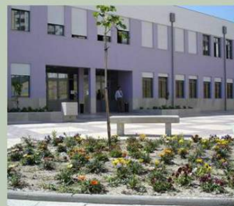
Agrupamento de Escolas Romeu Correia ad Almada Portogallo